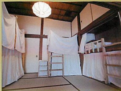
男女混合ドミトリー 普通 3500 円 小 3200 円 Mix dormitory normal size bed JPY3500 small size bed JPY3200