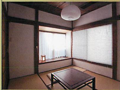
4.5 畳部屋 (2 人用) 9000 円 Room for 2 persons JPY9000