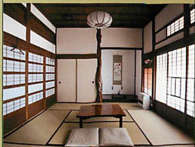
8 畳部屋 (4 人用) 16000 円 Room for 4 persons JPY16000